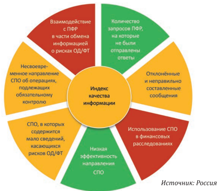
Рисунок 7.1.: Индекс качества информации в «личном кабинете» на сайте Росфинмониторинга